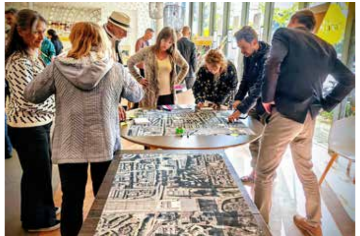
De plannen voor het Central Innovation District worden bekeken tijdens een informatieavond voor de buurt in O3.