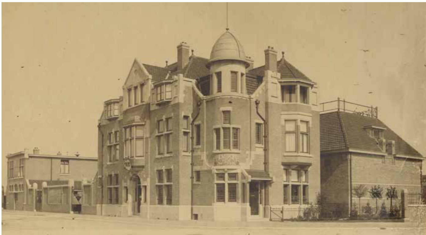
De Drie Hoefijzers in 1913 met v.l.n.r. de stalling, de kantoorvilla en het koelhuis.