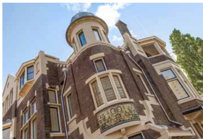
Detail: de koepel en het tegeltableau op de kantoorvilla.