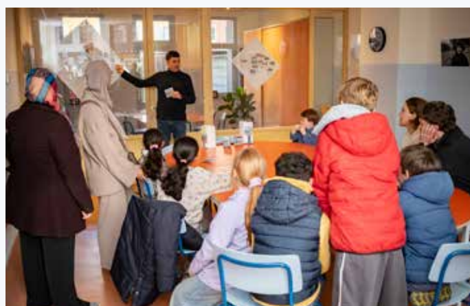
Op 17 januari in het WIJKLOKAAL. Veel kinderen van de Jan van Nassauschool zijn al enthousiast aan het verzamelen en ruilen van de plaatjes.