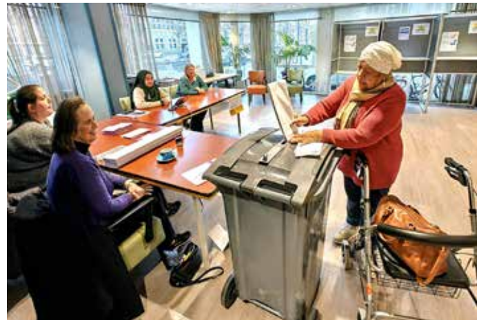
Het stembureau in woonzorgcentrum Rivierenbuurt (Christoffel Plantijnstraat 3). Dit stembureau is geadopteerd door ambtenaren.

"Uitgangspunten voor de locaties zijn: goede spreiding over de stad, goede toegankelijkheid en vastigheid. Stembureaus moeten opkomst bevorderend, dichtbij en makkelijk te vinden zijn. Daarom wisselen we zo min mogelijk. En iedereen moet zelfstandig het stembureau kunnen bereiken, ook mensen met een fysieke beperking. We letten op drempels, minimale deur- en gangmaten, en willen het liefst dat de stemruimte op de begane grond dichtbij de ingang is. De ruimte moet minimaal 30 m 2 zijn voor de stembokjes, stembussen en tafels zodat er nog voldoende ruimte overblijft voor draaicirkels van rolstoelen en rollators. En het moet ook betaalbaar zijn; we kunnen een vergoeding voor het gebruik van de ruimte betalen, maar zijn natuurlijk zuinig met belastinggeld. De meest voorkomende locaties zijn wijkcentra en daarna scholen. Er zijn ook bijzondere locaties zoals bijvoorbeeld het Oranjehotel op Scheveningen, het skatepark in de Sportcentrale in Laak of HFCC Racing, een vereniging voor bestuurbare autootjes in Loosduinen."