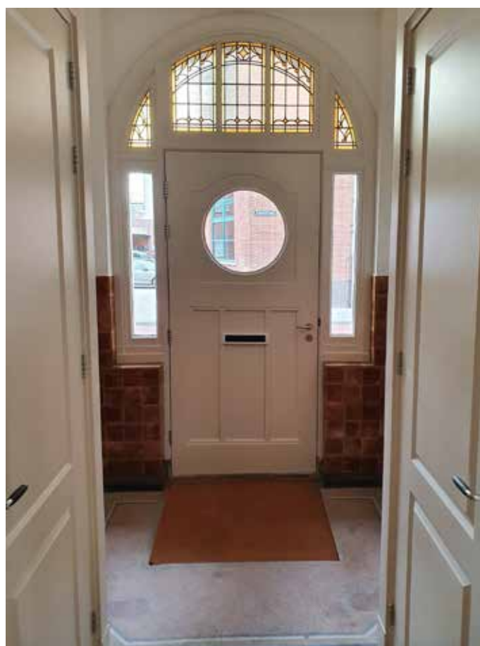
Detail: de entree van de kantoorvilla van binnenuit gezien.