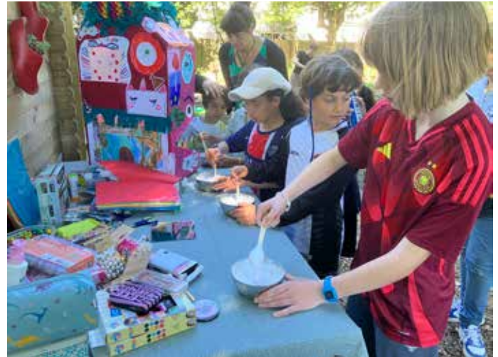
Kinderen knutselen in de wijktuin tijdens een van de activiteiten in 2025.

Tekst: Irene Kelder