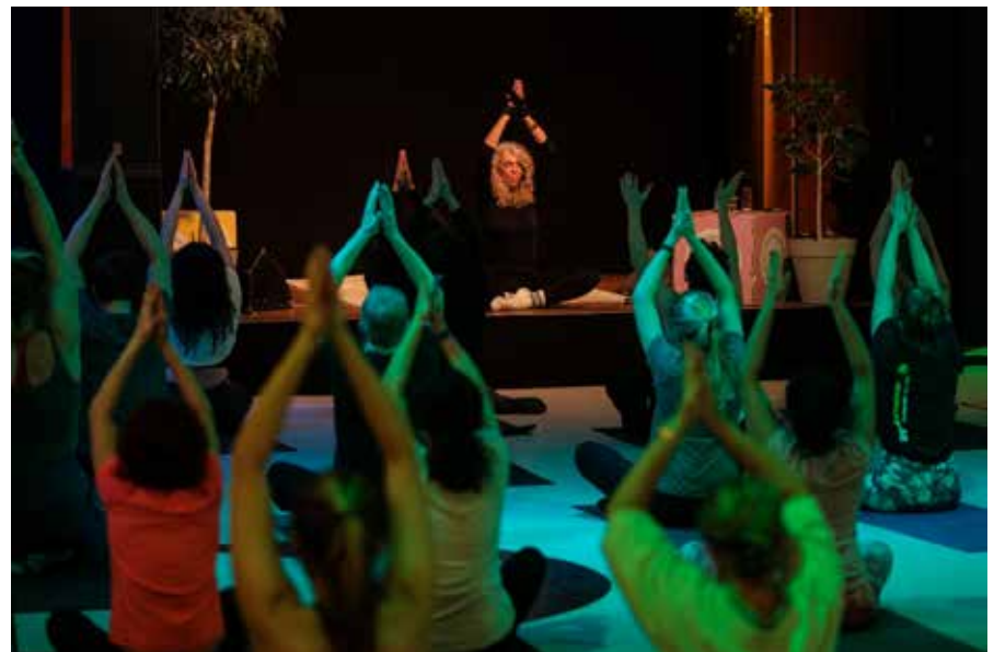
Zondagmiddag voor families met kinderen tot 12 jaar. Een verrassende mix van muziek, dans en alles daarbuiten en tussenin.