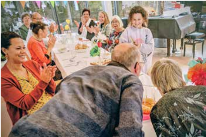
Samenzijn bij een bijeenkomst van buurtkerk Havenlicht

Al jaren wordt er gediscussieerd over de prostitutiezone in de Rivierenbuurt. Vaak gaat het over beleid, veiligheid en overlast. Maar zelden over de diepere vraag onder dit alles: wat maakt een wijk tot een gemeenschap, en hoe herstellen we dat wanneer het onder druk staat?