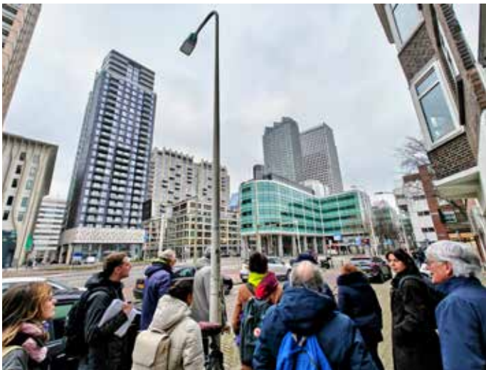
De groep inspecteert de Ammunitiehaven waar veel overlast is.