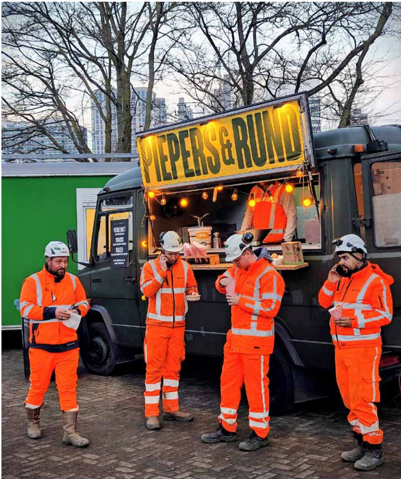
Tekst en foto: Joris Wijsmuller

Weken lang werd er dag en nacht, zeven dagen per week, in weer en wind en vrieskou gewerkt aan de herinrichting van de sporen langs de Lekstraat. Perrons zijn verlengd, wissels zijn weggehaald en sporen 11 en 12 weer in dienst genomen zodat er meer treinen kunnen rijden en de dienstregeling betrouwbaarder wordt. Ook zijn over een lengte van 900 meter tussen het station en Schenkviaduct de kabels en leidingen vernieuwd, want treinen werken op elektriciteit. De arbeiders werkten op de brandstof piepers en rund.