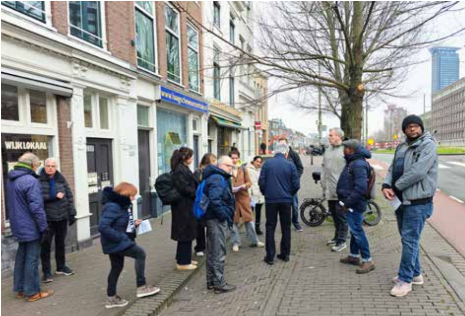
Ambtenaren en bewoners verzamelen voor het Wijklokaal aan het Spui voor de wijkschouw.

Aan het eind van de middag op 9 februari verzamelde een flinke groep bewoners en ambtenaren zich in het WIJKLOKAAL om na lange tijd weer een wijkschouw te doen. Het werd een heel nuttige schouw langs vooraf toegestuurde probleemsituaties. Bewoners konden ook onderweg nog problemen aangeven.