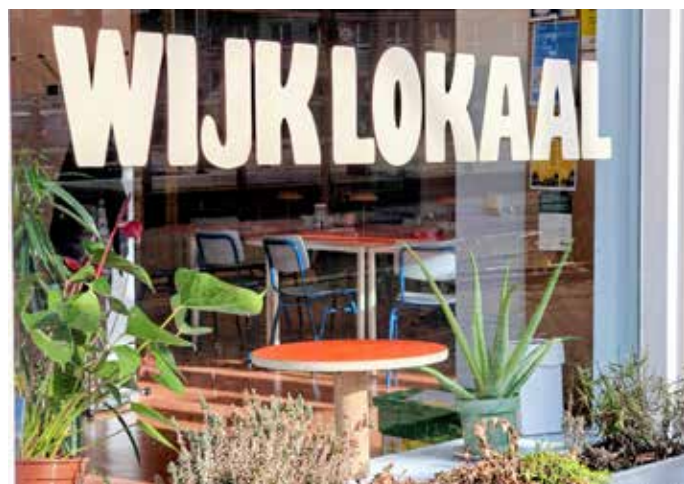
Er komt nu ook een stemlokaal in het Wijklokaal (Spui 248a). Verder zijn er stembureaus in O3 (Zaanstraat 25), het Ministerie van Binnenlandse Zaken (Turfmarkt 147) en het stadhuis (Spui 70).