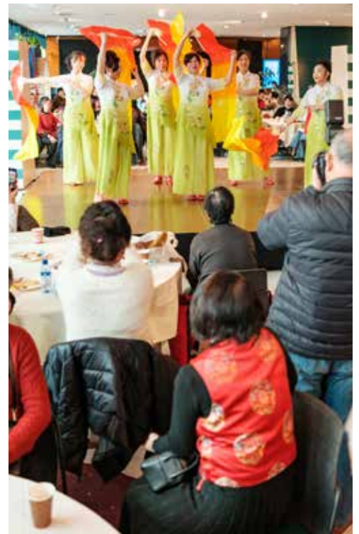
Vrouwen dansen tijdens het Chinese Nieuwjaar.