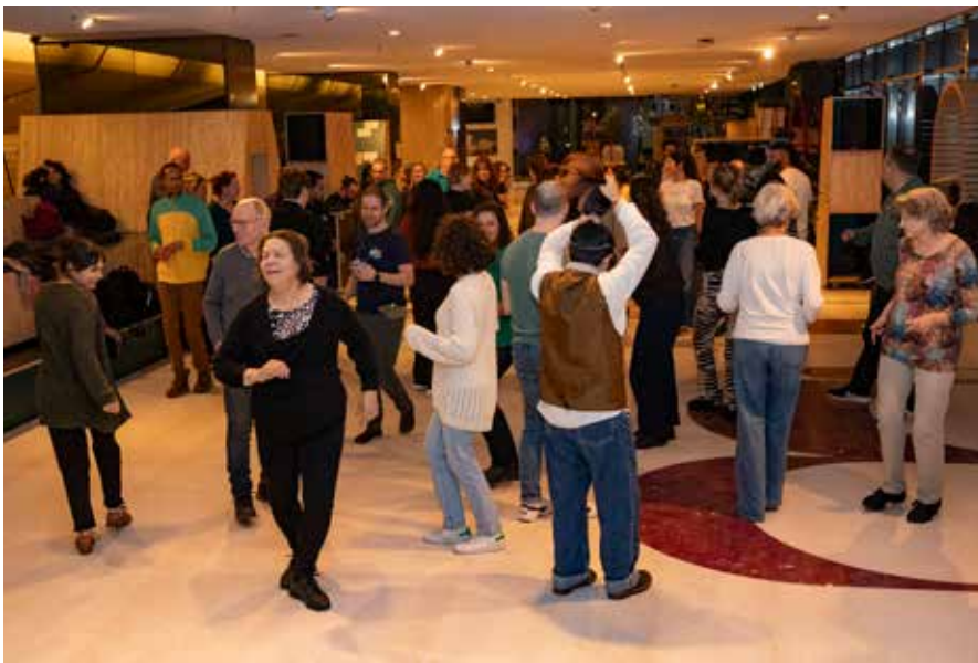
Workshop Braziliaans dansen Forró van Social Dance. Mensen van alle leeftijden en nationaliteiten leren de eerste stappen.