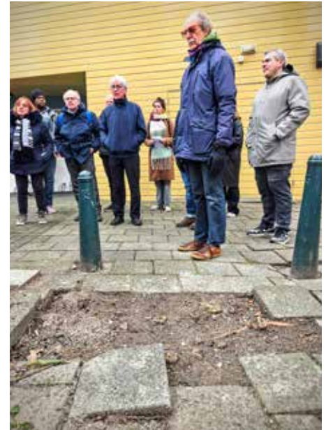
Op het Lamgroen en Bleekveld is een opknapbeurt hard nodig.