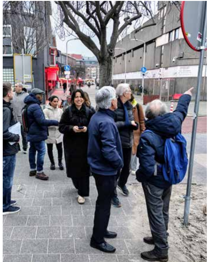
Tijdens de wijkschouw kwam de overlast dat het raamsekswerk met zich meebrengt weer eens aan de orde.

Bewonersorganisatie Rivierenbuurt/Spuikwartier en Wijkorganisatie Het Oude Centrum.