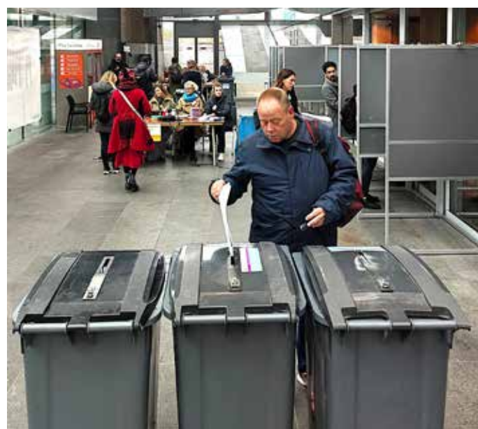
Het stemstation in Centraal Station (Kon. Julianaplein 10) is handig voor forenzen die in Leiden, Gouda, Rotterdam of verder weg moeten werken.