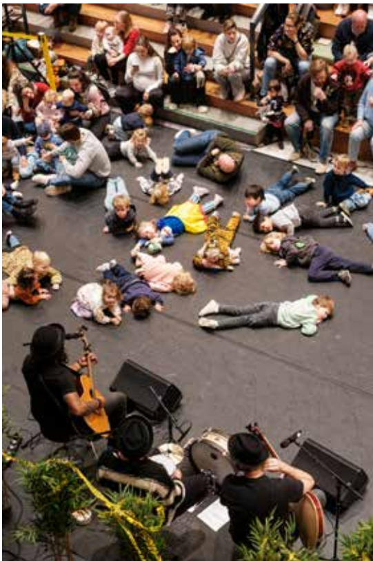
Yotechka. Een techno Yoga die ademhaling en mindfulness met techno muziek combineert.