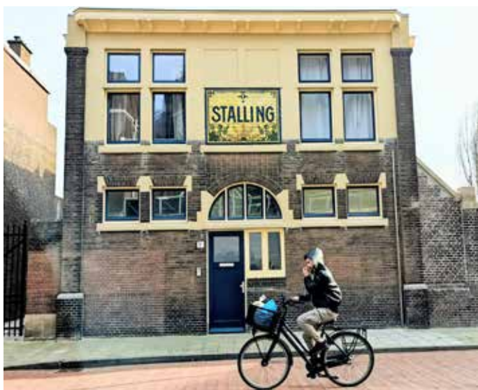
In de paardenstalling zijn recent 4 appartementen opgeleverd.

den Breems van Stadsherstel zich. De bierflessenkelder was met beton dichtgestort, de wagenremise was gesloopt en in het hoofdkantoor waren krakkemikkige studentenwoningen getimmerd.