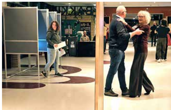
Stemmen kan ook in theater Amare (Spui 150) naast de danslessen.