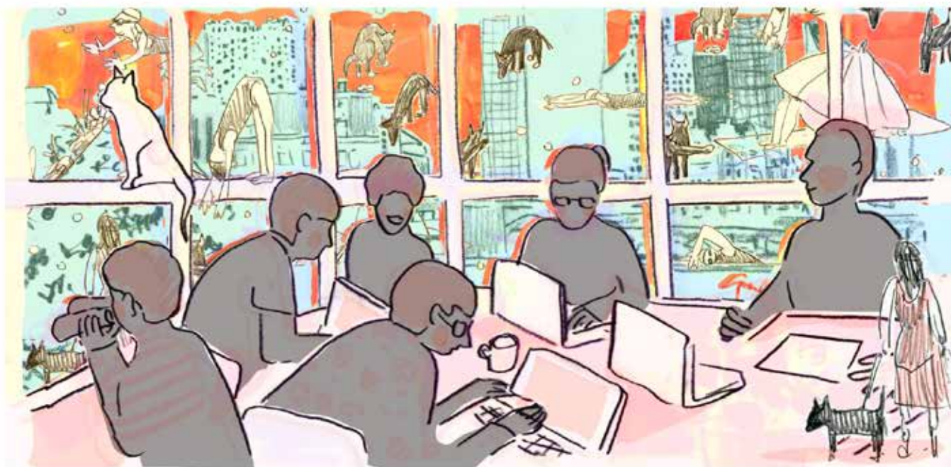
Illustratie: Babette Wagenvoort

Dat het klimaat verandert is goed te merken. De zomerwarmte begon al in april. Elk nadeel heeft z'n voordeel. Voor de fotografen genoeg dagen om met mooi weer te fotograferen. Het resultaat mag er zijn. Er kon ook goed gewerkt worden aan alles wat een opknappbeurt moest hebben: de vernieuwing van het Spuiplein, het verstevigen van de kades en het vervangen van de rioleringen. Het is een tijdje een rommel maar eenmaal klaar dan heb je ook wat moois. Er werden Gulden Klinkers door de Gemeente Den Haag uitgedeeld. Een beloning van de gemeente voor actieve bewoners die de wijk een stukje mooier maken. Meneer Moes uit de Hekkelaan en de wijktuingroep kregen er een. We kregen een tip van een lezer om eens over de hondenuitlaat plekken te schrijven. We spraken een bewoner die het opruimen van de uitwerpselen stimuleert door zakjes aan te bieden. We schreven over jong en oud. De activiteitenagenda is er ook weer. Je kunt uitkijken naar activiteiten in de buurt. Van muziek en dans, sport en theater, rommelmarkt en lezingen. Samen voor een mooie, schone en gezellige Rivierenbuurt en Spuikwartier.