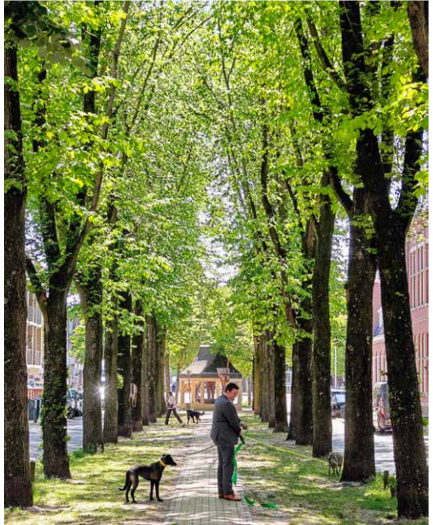
Aangelijnd tussen de middag op de Nieuwe Haven.

Tekst: Hetty Gijzen