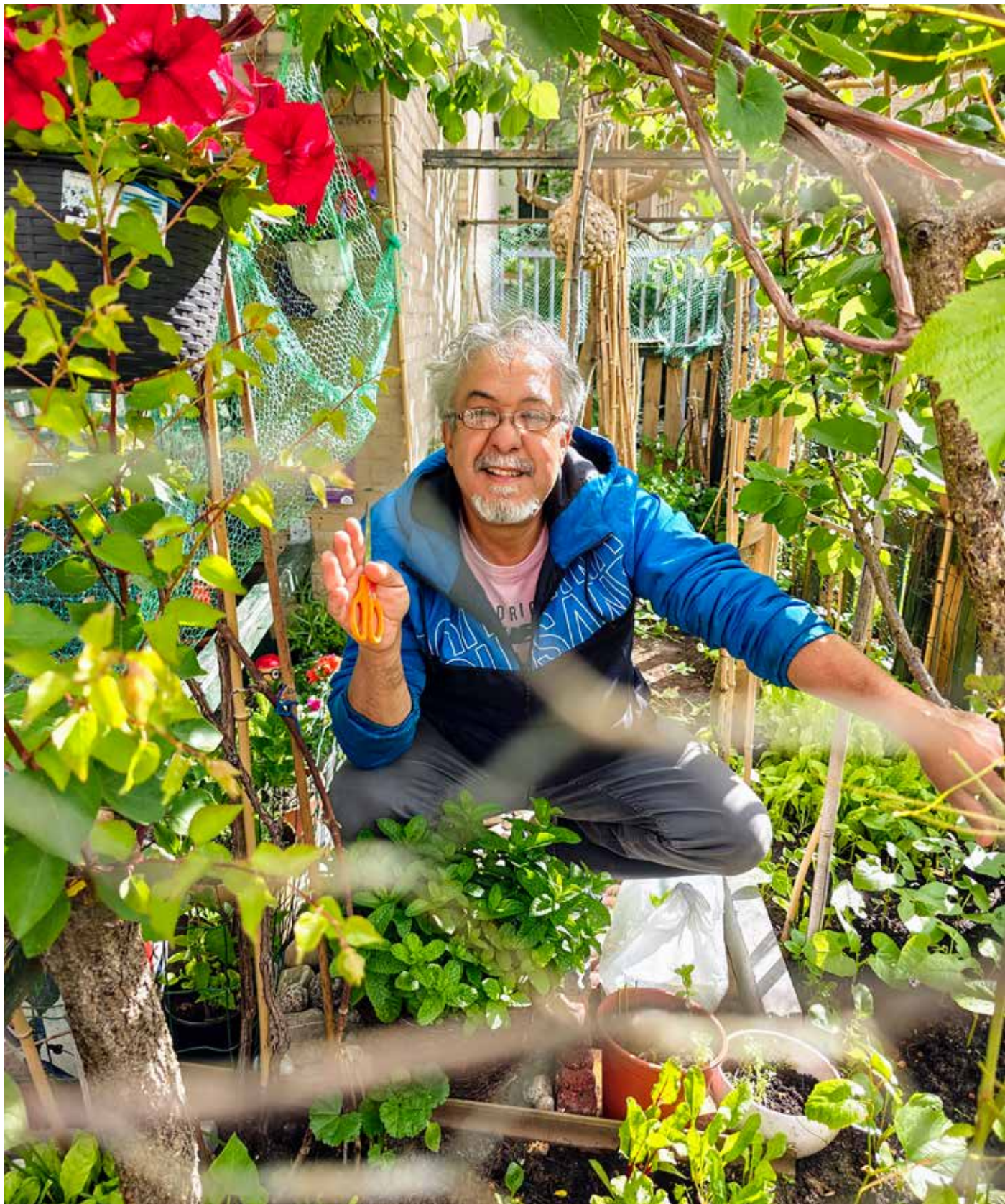
Tekst en foto: Joris Wijsmuller

Al meer dan 10 jaar verzorgt Moes het groen in de buurt rond zijn woning aan de Hekkelaan. Hij is altijd vrolijk en onvermoeibaar in de weer met snoeischaar, schep en emmers waarmee hij het water voor de planten uit de gracht bij de Uilebomen haalt. Vorig jaar kreeg hij bij uitzondering als individu een gulden klinker van de gemeente voor zijn inzet voor een groene leefomgeving. Moes heeft nu een nieuw idee: een buurtmoestuin bij de Hekkelaan op het veldje waar net 3 grote bomen zijn gekapt. Doe je mee?