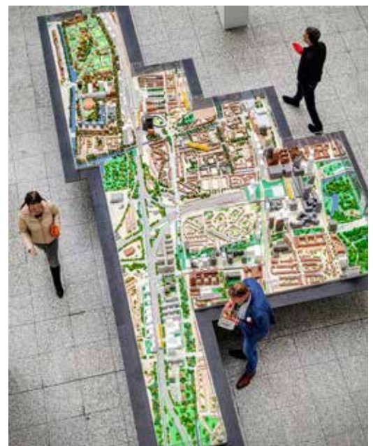
Maquette van het CID gebied in het stadhuis

Tekst: Bart de Vries, namens de Werkgroep CID