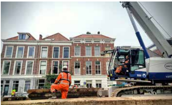
Voorjaar 2023: werkzaamheden kademuren met kranen vanaf het water.

Dat gebeurde toen duidelijk werd dat het werk langer ging duren dan eerst was gepland. Hoewel Dura Vermeer het meest zichtbaar is, schakelen de nutsbedrijven hun eigen aannemers in voor het werk aan de kabels en leidingen. "Het onderling afstemmen van alle planningen is een complexe zaak. De mensen en het materieel van alle aannemers moeten op het goede moment beschikbaar zijn. Materialen hebben soms hele lange levertijden. Dat maakt het ingewikkeld om alles in de ideale volgorde achter elkaar te doen. Die situatie deed zich hier ook voor."