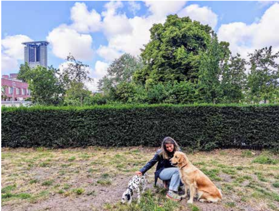
Een warme ontmoeting aan de Reggestraat.

Rivierenbuurt en Spuikwartier zijn dichtbevolkte wijken waar naast mensen ook veel dieren wonen. Er zijn best veel honden en gelukkig ook best veel loslooplegebieden in onze wijk. De redactie ging op onderzoek.