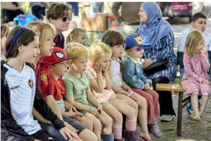
Poppentheater Cassiopeia speelt Jan Klaassen en Katrijn. De kinderen vinden het fantastisch.