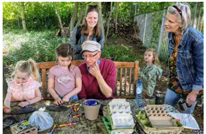
Voor iedereen was er een creatieve workshop: aquarellen, natuurbingo en een grabbelton.