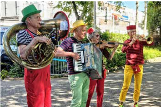
De dag begon swingend met een optreden van Circo Sollievo