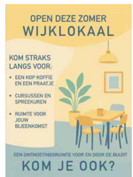
Een uitnodigende poster gemaakt door kwartiermaker Sam Hurulean.

Tekst: Shelley Kouwenhoven