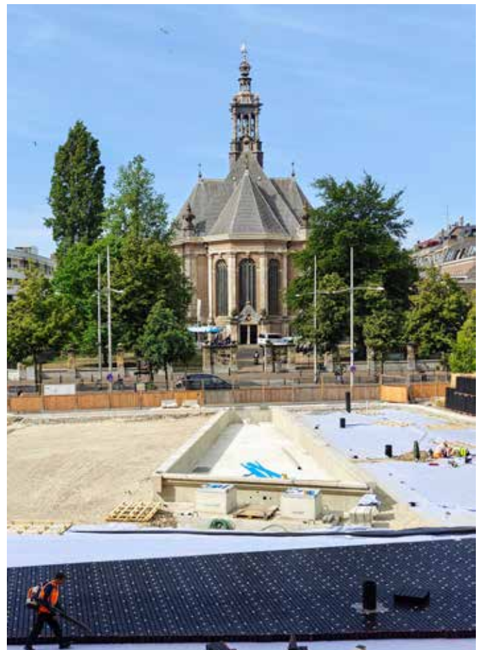
De werkzaamheden voor de herinrichting van het Spuiplein, met in het midden de bak voor de waterpartij, gezien vanuit Amare.

Tekst: Jan Elsinga | Foto: Joris Wijsmuller