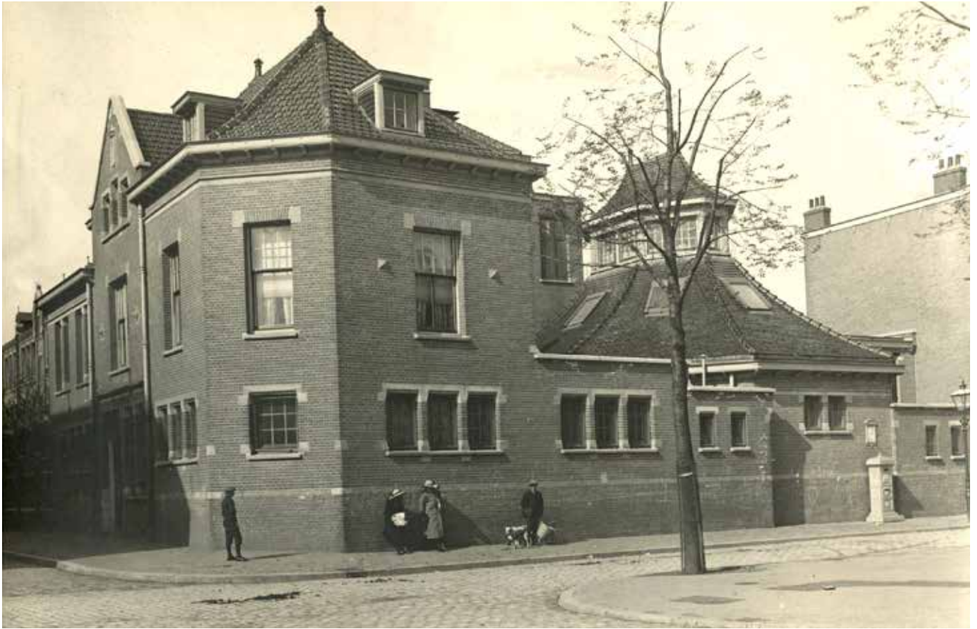
Het badhuis op de hoek Nieuwe Haven en Nieuwe Havendwarstraat in 1910.

Aan het einde van de 20ste eeuw groeide Den Haag flink. Het aantal inwoners verdubbelde van 100.000 in 1875 naar 200.000 in 1900. De industrialisatie, bloeiperiode voor ondernemingen zoals ijzergieterij Van Enthoven en de Prins van Oranje, zorgden voor veel werkgelegenheid in de Rivierenbuurt. Vooral jonge gezinnen en vrijgezellen trokken naar de stad om een nieuw bestaan op te bouwen. De komst van al deze jonge mensen zorgde weer voor een flinke stijging in het aantal geboortes.