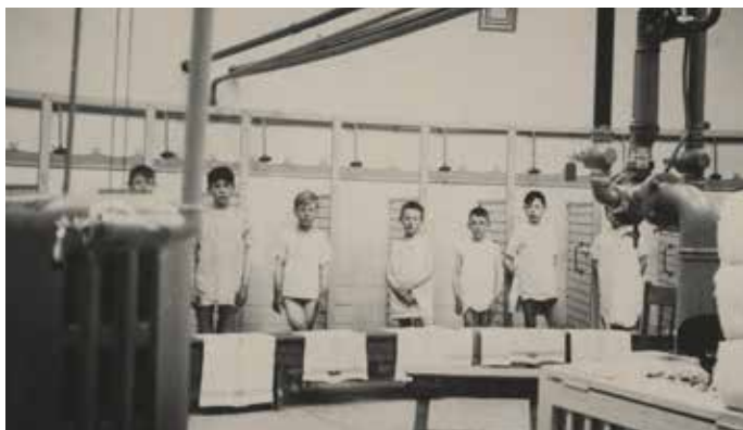
Schoolkinderen in 1910 in het badhuis.

te douchen, aan te kleden en naar buiten te gaan. Treuzelaars werden gewaarschuwd met een bons op de deur. Duurde het te lang, dan maakte de badmeester de deur subiet open.