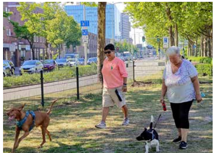
Samen aan de wandel bij de Lekstraat.