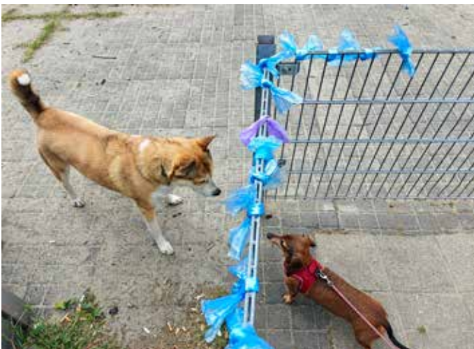
Het hek op de Hekkelaan biedt meerdere voordelen.