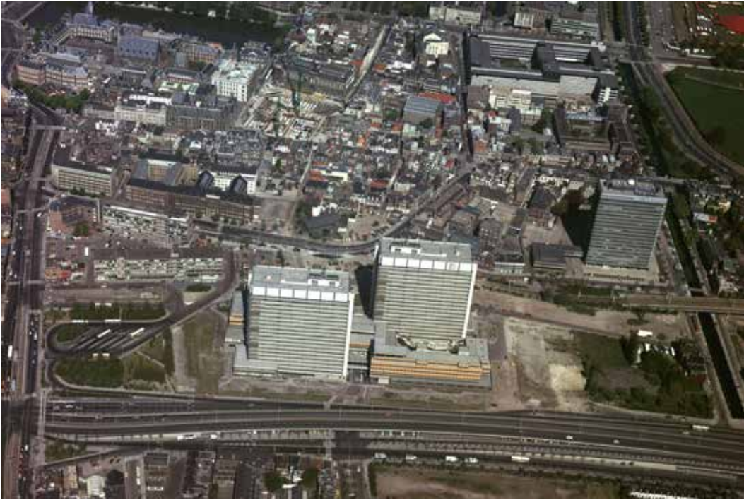
Het Spuikwartier in 1980, na de sloop en de eerste grootschalige nieuwbouw