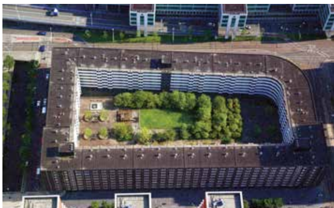
De Zwarte Madonna gezien van bovenaf met boven de Schedeldoekshaven en onder de Turfmarkt.