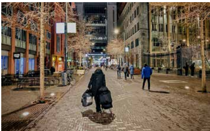
Met alles wat je bezit van plek naar plek verhuizen.