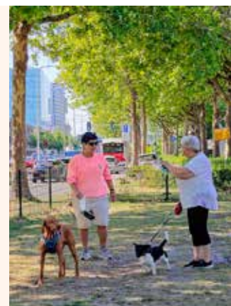
Buurtbewoners laten hun honden uit op het veldje aan de Lekstraat.

Tekst: Amber Kuckulus van Wijkz | Foto: Joris Wijsmuller