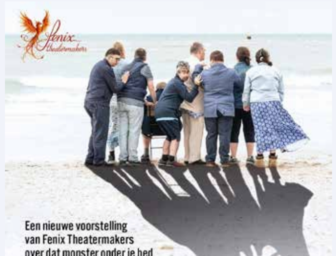
Een nieuwe voorstelling van Fenix Theatermakers over dat monster onder je bed