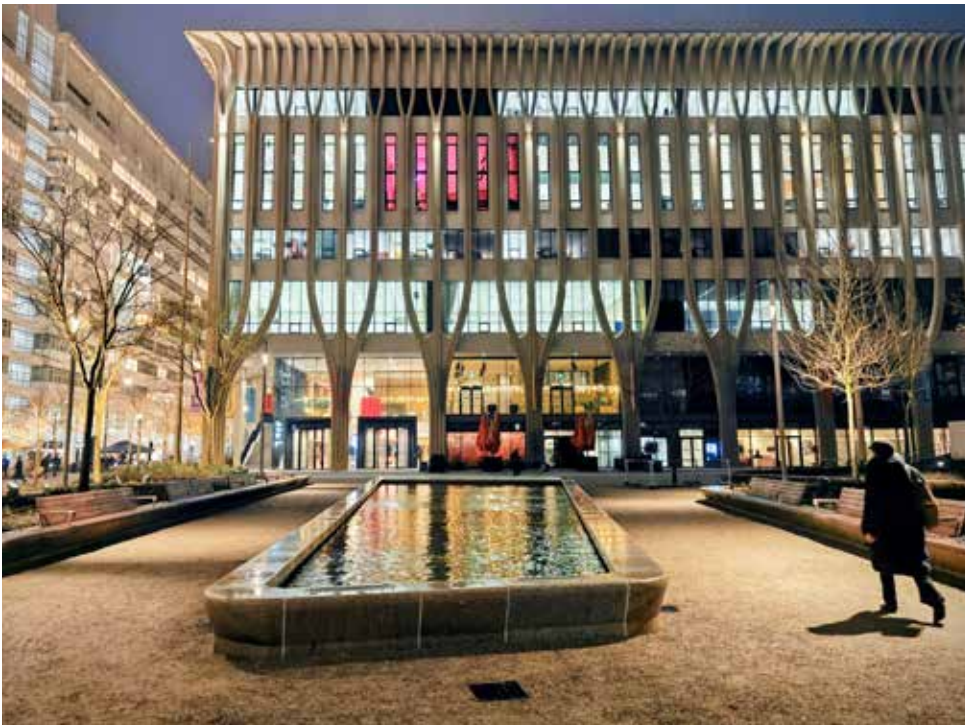
'Het Spuiplein heeft nu bomen die 's avonds worden uitgelicht

Tekst: Bernice Willemsen