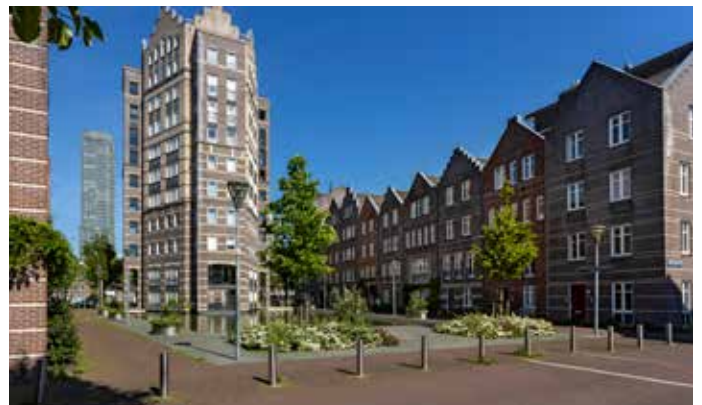
Vernieuwing in de Rivierenbuurt op de plek waar de Staatsdrukkerij stond