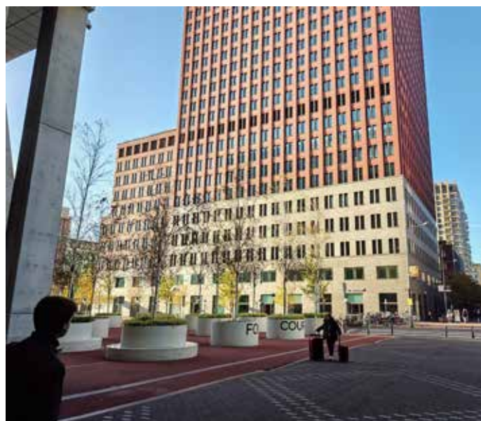
De ministeries van Justitie en Binnenlandse Zaken gezien vanaf de hoek bij de Zwartebrug.

De ontwikkeling van het Spuikwartier vorderde, en langzaam maar zeker werd de Zwarte Madonna een