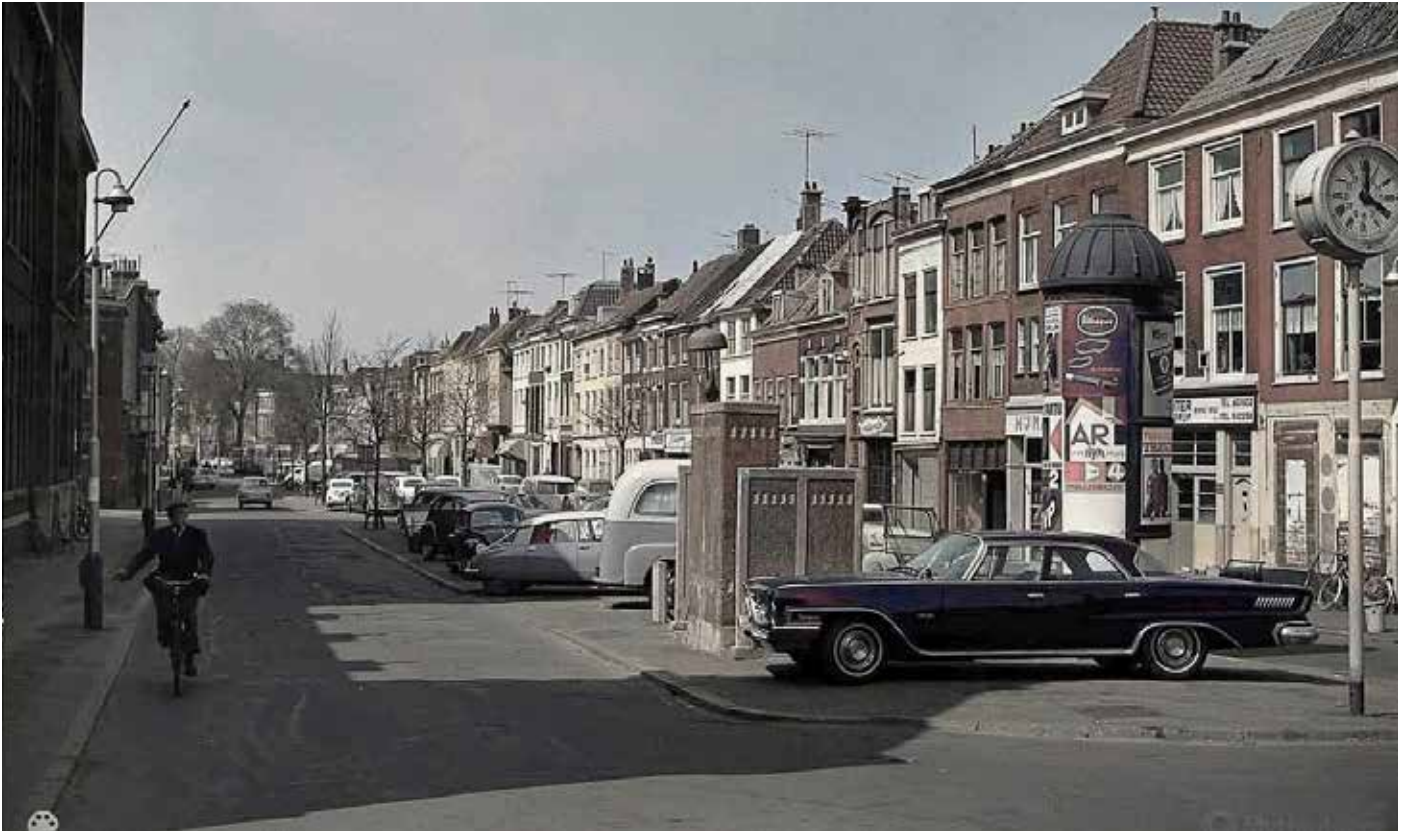
Zicht op de Nieuwe Haven met aan de linkerkant de ambachtsschool. Let vooral op de details rechts op de foto.