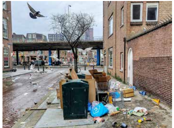
Een voorbeeld van hoe het niet moet. Sparnedwardsstraat

Papier en karton (kleingemaakt) kan in de speciale papierbakken gedaan worden. Er staan papiercontainers onder het Prins Bernardviaduct, op de hoek Maasstraat/