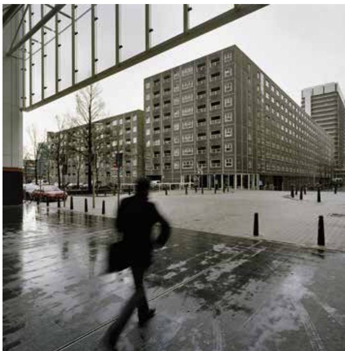
De Zwarte Madonna gezien vanaf de hoek bij de Zwartebrug.

Het gebouw was sober vormgegeven met aan de buitenzijde prefab betonelementen met kleine ramen en zwarte tegeltjes. Weeber zei hierover: 'Het werd in witte tegels ontworpen, maar op weg naar de welstandscommissie veranderde ik de kleur. Architect Hoogstad was bezig met een wit ministerie voor VROM, daar stonden al de witte Koninklijke Bibliotheek en het witte Rijksarchief. Het stadhuis was er nog niet, maar je kon het wit al ruiken.' De kleur werd dus zwart. De witte binnenkant van het gebouw vormde een groot contrast met de zwarte buitenkant en de drukke stad: ruwe bolster, blanke pit. De door buurtbewoners bedachte naam Zwarte Madonna verwijst naar de zwarte gevel én naar de populaire zangeres Madonna wiens ster in die jaren begon te rijzen.