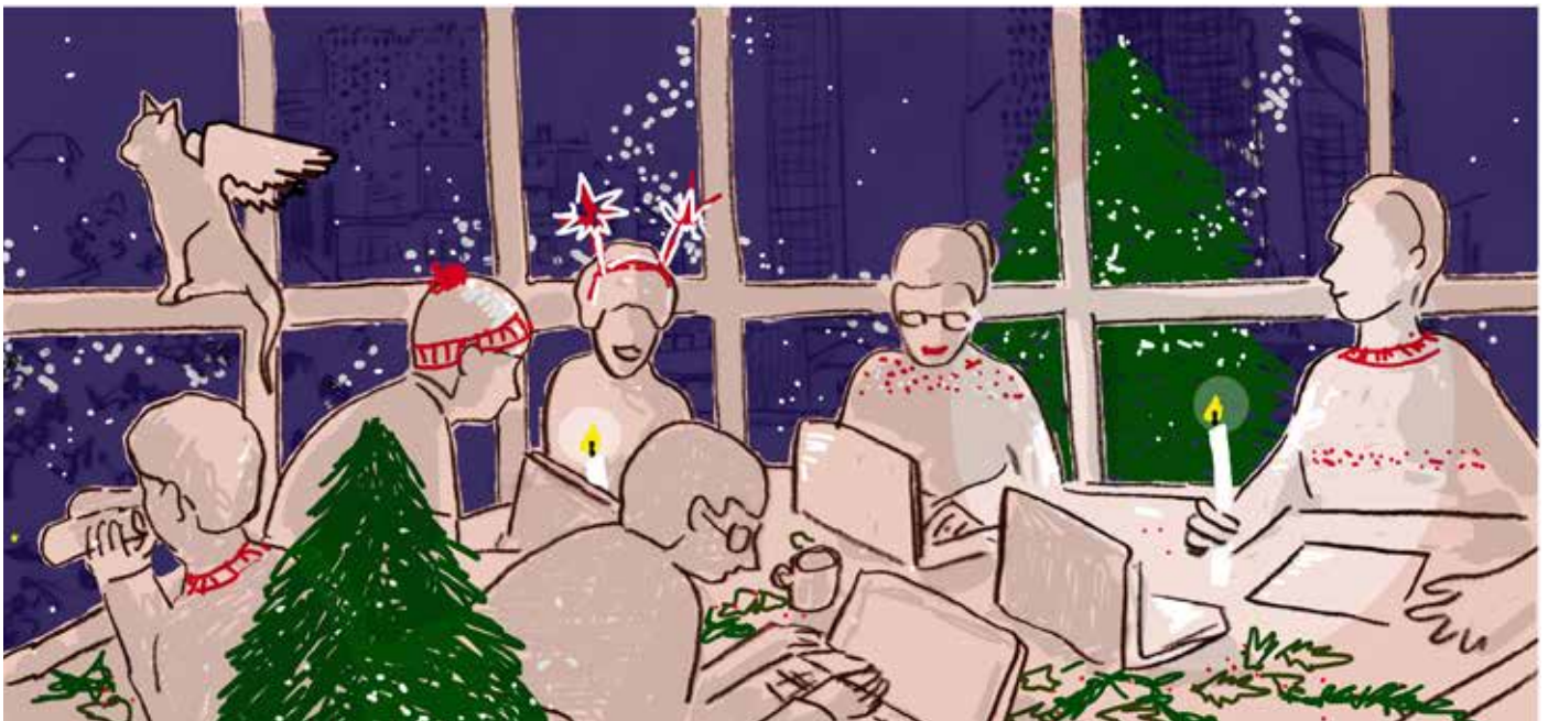
Illustratie: Babette Wagenvoort

Wij wensen al onze lezers een mooie jaarwisseling en een liefdevol 2026 met aandacht voor elkaar.