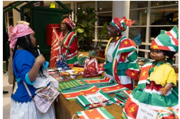
50 jaar onafhankelijkheid van Suriname. Een viering in de Centrale Bibliotheek.

Voor deze bijzondere mijlpaal transformeerde de bibliotheek tot een feestelijke ontmoetingsplek vol muziek, cultuur, eten en herinneringen. Bezoekers kwamen in prachtige, kleurrijke traditionele kleding – een levendige weerspiegeling van de rijkdom van de Surinaamse cultuur. Wie de gebruiken even was vergeten, kon terecht bij de workshop traditionele Afro-Surinaamse kleding. Ook Suriman en zijn dochter Sranami waren aanwezig. Met hun vrolijke energie en opvallende outfits gingen ze graag met bezoekers op de foto en zorgden ze voor een feestelijke sfeer.