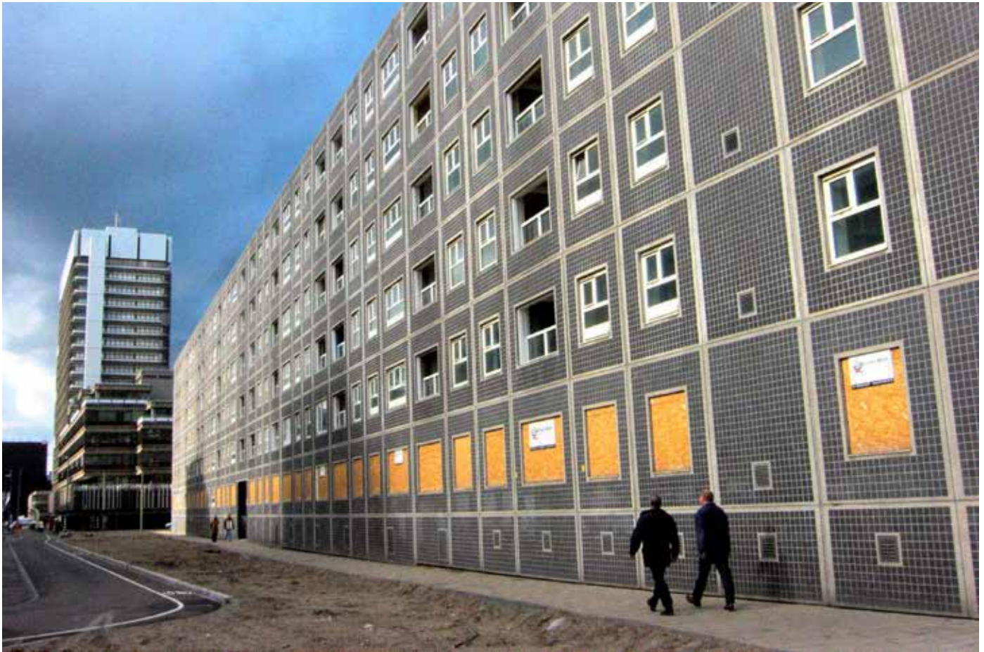
De zijde aan de Schedeldoekshaven nadat de eerste bewoners onder druk van de sloopplannen waren vertrokken.