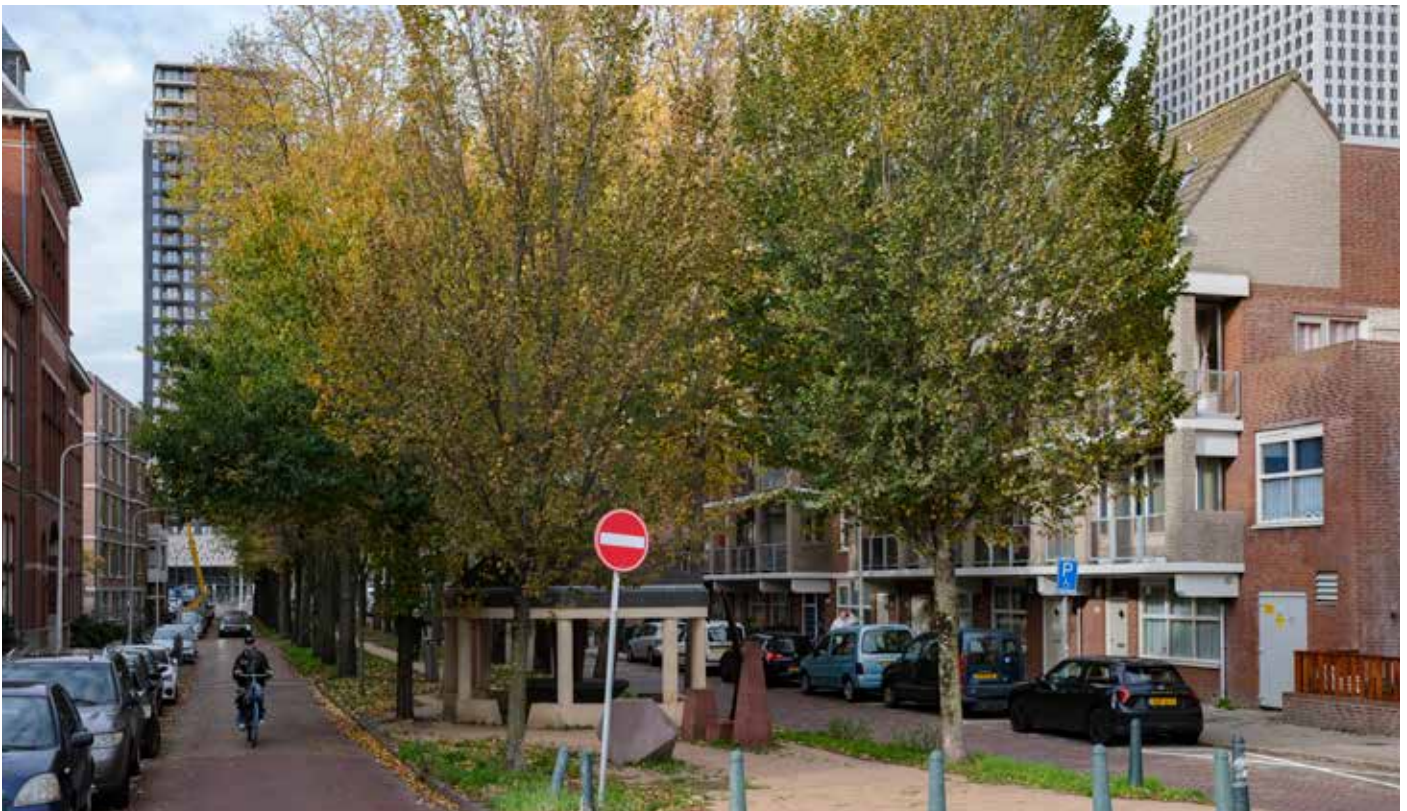
Een hedendaagse foto van dezelfde plek met wonen in de voormalige ambachtsschool en verdwenen pareltjes die een straat zo leuk maakte.

Heeft u een leuk idee voor een Toen-en-Nu? Stuur dan een mail naar redactie@brs-denhaag.nl .