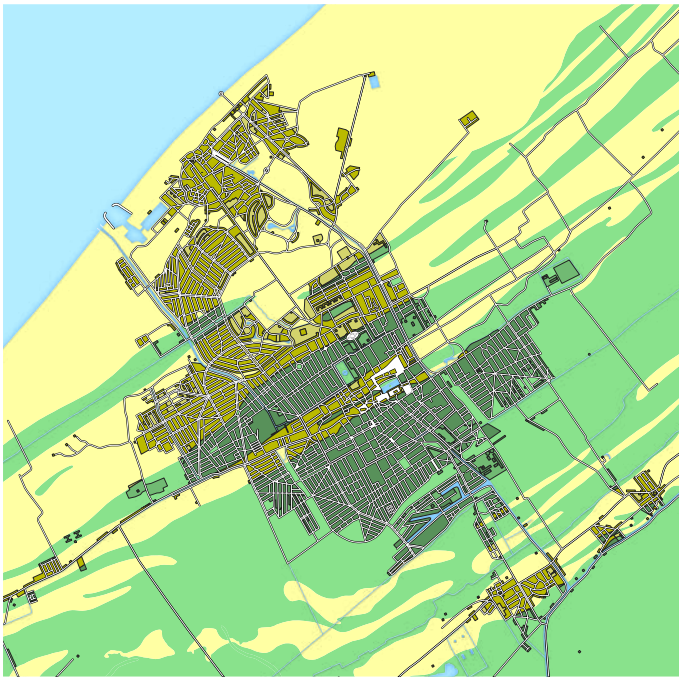
De ontwikkeling van de stad werd bepaald door het zand en het veen met hier de stad in 1918