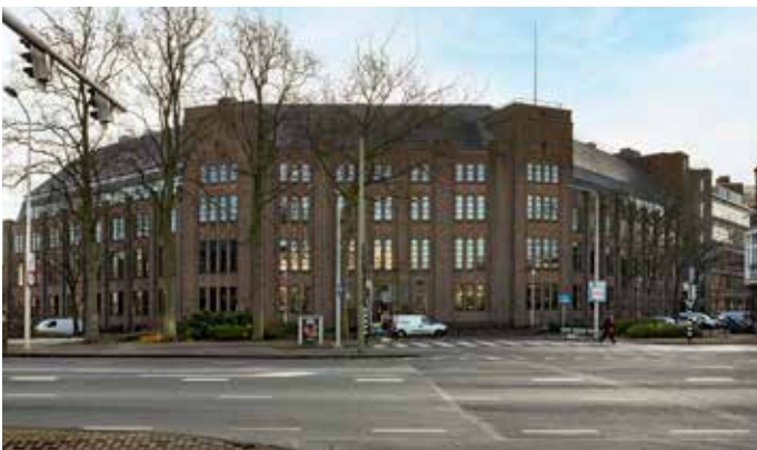
Het oude Casema-gebouw aan het Spaarneplein is een geslaagd voorbeeld van het hergebruik van bestaande gebouwen

Het Haagse stadsbeeld is verkrijgbaar bij de meeste Haagse boekwinkels en via de website van uitgeverij WBOOKS.