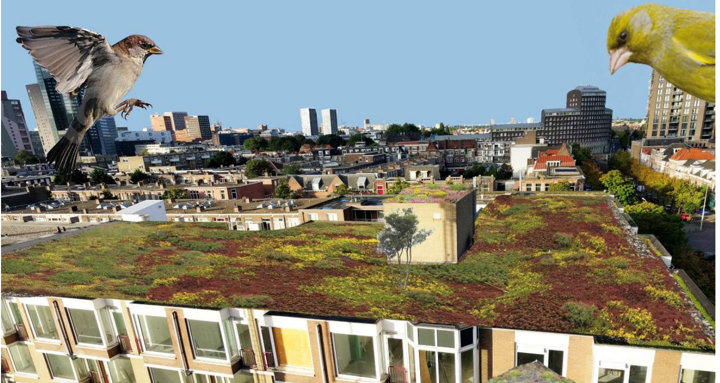
Collage van Babette Wagenvoort

Tijdens warm weer wordt het heet in onze buurt: woningen van baksteen, asfalt, te weinig groen. Bomen worden gekapt voor renovatie van de kademuren. Den Haag vormt een hitte-eiland binnen de regio. In het Centrum, in de Rivierenbuurt is het erg heet in vergelijking met andere stadsdelen. TU Delft (2017) onderzocht dat sterfte onder ouderen (75+) in hete zomermaanden relatief hoger is dan in andere wijken. Universiteit Wageningen concludeerde: de hitte is 'onacceptabel en brengt gezondheidsrisico's met zich mee'. Hun advies: platte grijze dakbedekking met grint aanpakken. Vergroenen helpt echt.