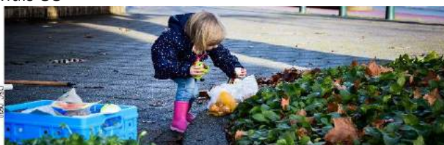
Kinderen deden mee.