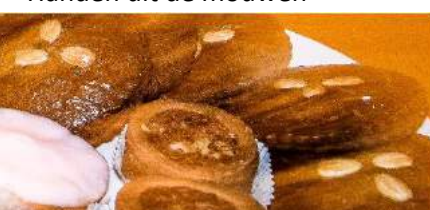
Koeken van Bakker Vlinder