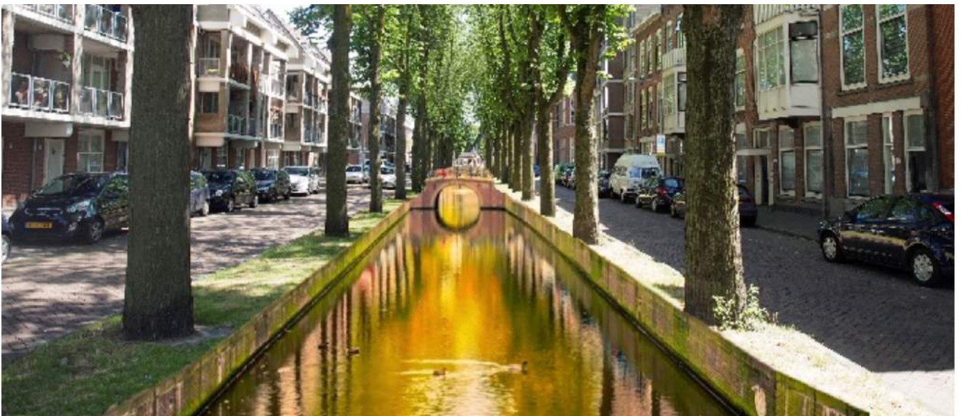
Nieuwe Haven (fotoshop)

Prachtige plannen die ook voor onze buurt van belang kunnen zijn. Een van de ideeën om de Voldersgracht open te graven, zodat je daar aan de oever van de ‘Gracht van de Hema’ je Hema worst kan opeten, sprak mij wel in het bijzonder aan.