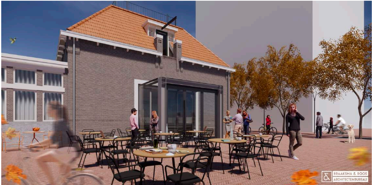
Sfeerimpressie van bakkerij en restaurant De Broodbrouwers: Render_2018-10-29. Illustratie is van Architectenbureau Braaksma & Roos