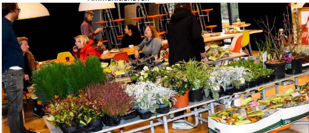
Start in buurthuis O3