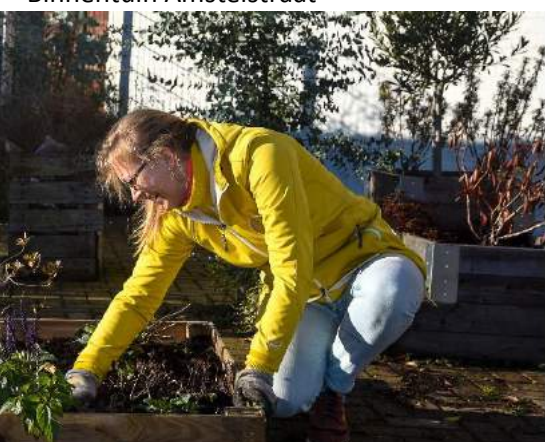
Handen uit de mouwen